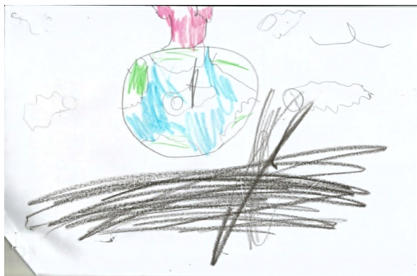
Figura 4. Desenho colorido, Aluno 4.

En la Figura 3 tenemos la predominancia de los colores azul y verde, en tonalidades diferentes, donde el azul significa tristeza, pero también representa calma. Y el verde significa que emocionalmente se trata de un individuo débil, que cualquier motivo lo lleva al cambio extremo del humor. Las características positivas de este color representan la seguridad, el coraje y la esperanza. El amarillo y el rojo representan la fuerza a la violencia, que pueden ser traducidas en rabia negativamente, y positivamente el amarillo representa la alegría.