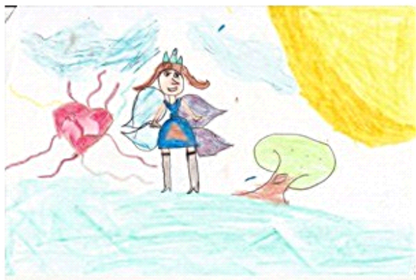
Figura 3. Desenho colorido, Aluno 3.