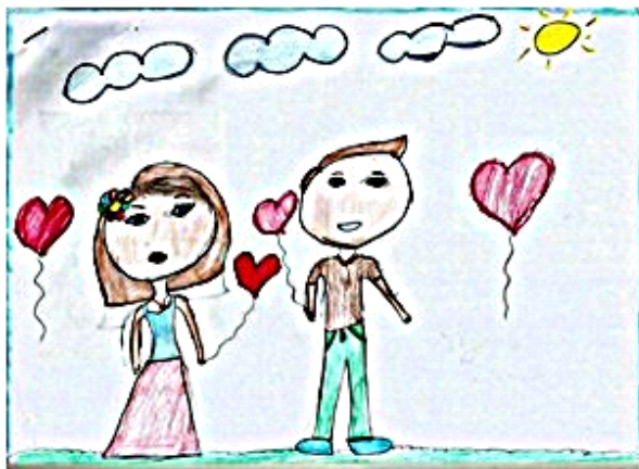
Figura 5. Desenho colorido, Aluno 5.

Sin embargo en este dibujo se pueden observar manifestaciones de deseo por parte del niño, deseos estos, vividos por él. Para Derdyk (1989, p. 51), "el dibujo manifiesta el deseo de representación, pero también el dibujo, ante todo, es miedo, es opresión, es alegría, es la alegría, es curiosidad, es afirmación. Al dibujar al niño pasa por un intenso proceso vivencial y existencial".