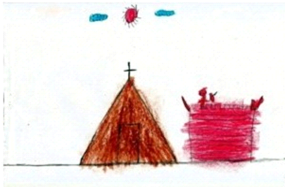
Figura 2. Desenho colorido, Aluno 2.

Según la profesora el niño es cuidado por una anciana que lo trata como un bebé, haciendo todas sus voluntades, así siendo, el niño siente dificultad en los contactos y presenta miedo ante nuevas actividades. En contraposición tenemos la alegría como forma de superación del miedo e intento de valorización de los aspectos externos, el alumno demuestra la capacidad de improvisar ante situaciones delicadas.