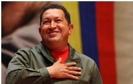
Figura 3. Presidente de la República Bolivariana de Venezuela Hugo Rafael Chávez Frías. Período (2002-2013).