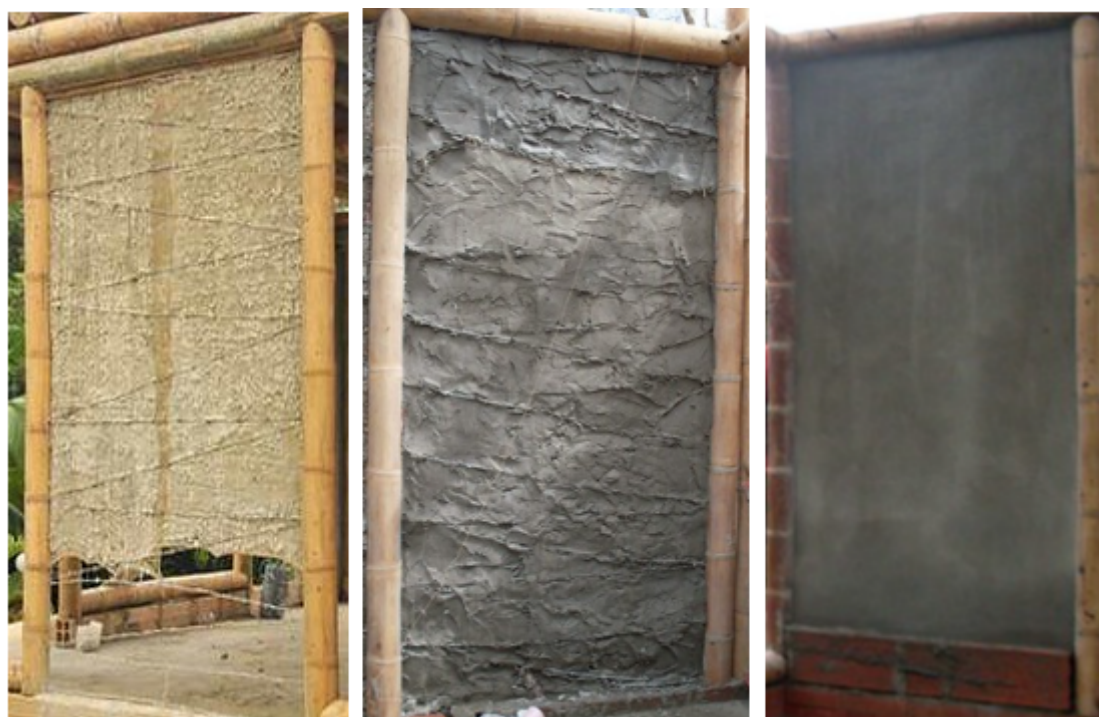
Figura 3 Construcción del sistema muro tendinoso